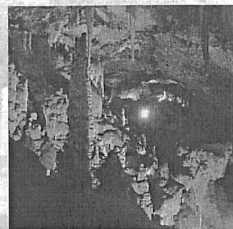
Cueva de Don Juan

La cueva de Don Juan se encuentra situada a 12 km, de Jalance, en un paraje de singular belleza. Su recorrido está bien adecuado al público, (con visitas guiadas), se ha conseguido un buen acondicionamiento que